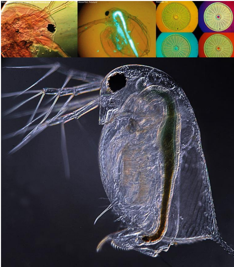
Wasserfloh Daphnia, mittels schräger Dunkelfeld-Mikroskopie aufgenommen. Größe ca. 1 mm.